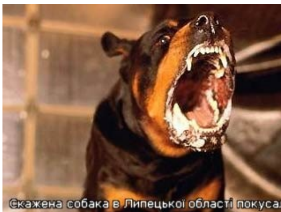
Скажена собака в Липецької області покусал

Собака веде себе дивно: змінюється її настрій, вона гарчить, забивається в темні кути, неохоче йде на поклик господаря, потім може несподівано почати ластитися до нього, радісно стрибати навколо нього — це стадія провісників хвороби. Також на цій стадії собака може нервово ходити по кімнаті, насторожено прислухатися до чогось, відмовлятися від улюбленої їжі. У грі почати злегка кусатися, кусати інших собак.